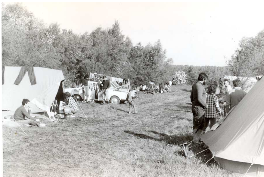
Dunajská ramena 1987 - tábořiště Bodíky