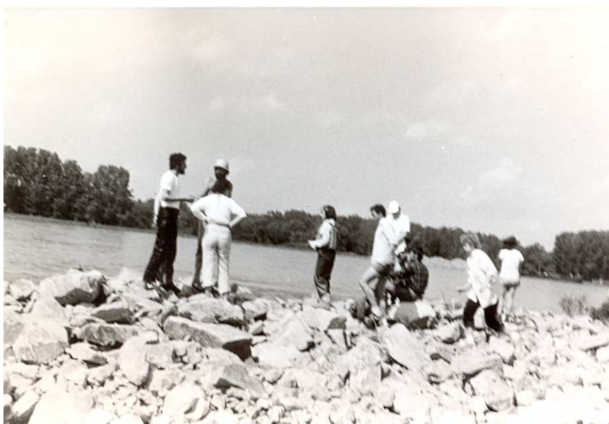
Na Dunajských ramenech, červen 1987