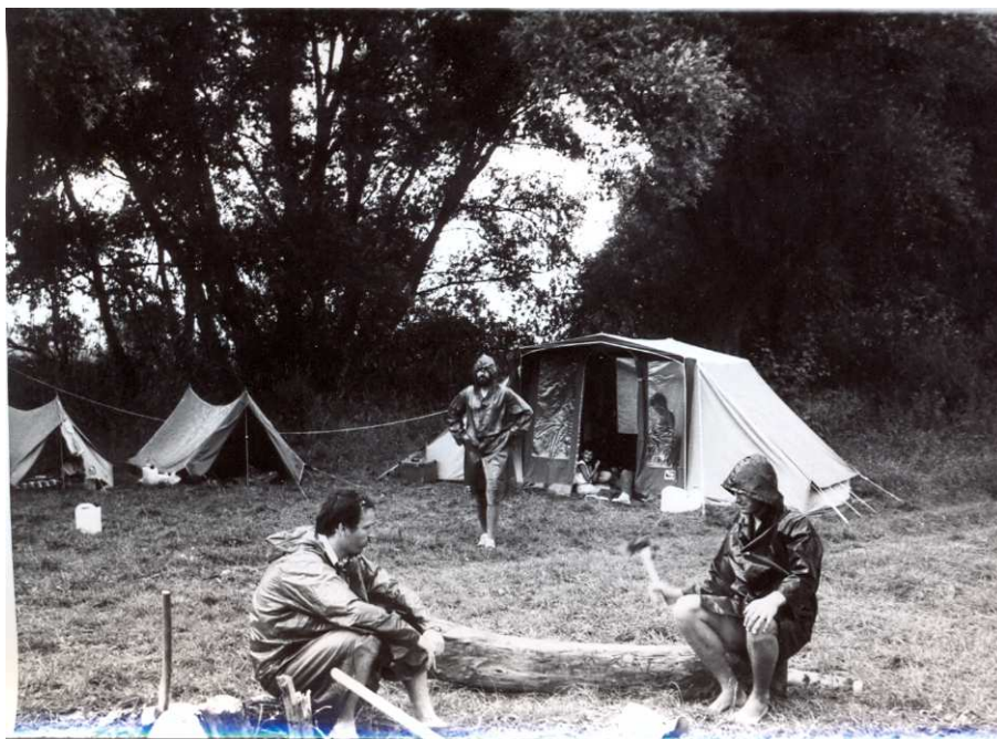
Hron 1985. Kozárovce poblíž kláštera Svätý Beňadík

Dunajská ramena jsme navštívili z jakéhosi sentimentu před tím, než měla zmizet pod hladinou Vodního díla Gabčíkovo 1 . Navštívili jsme obec Bodíky s asi 2000 maďarsky mluvícími obyvateli, která měla být zcela izolována od okolního světa.