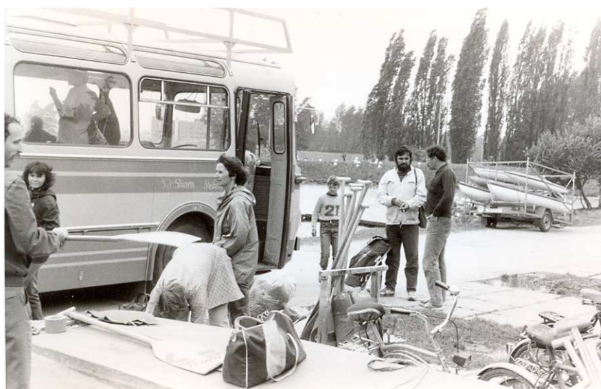
Piešťany 1987 - před odjezdem

Dunajská ramena jsme navštívili z jakéhosi sentimentu před tím, než měla zmizet pod hladinou Vodního díla Gabčíkovo 1 . Navštívili jsme obec Bodíky s asi 2000 maďarsky mluvícími obyvateli, která měla být zcela izolována od okolního světa.