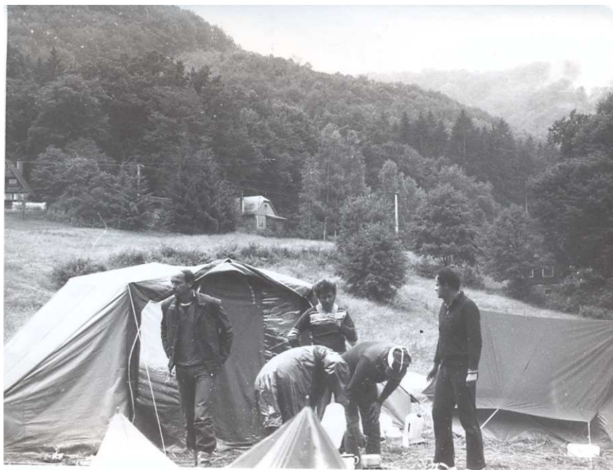
Hron 1958. První tábořiště - Červený Medokýš

Sjezd Hronu byl pro mne jakousi reprízou naší rodinné výpravy v roce 1961; mnoho se to na řece nezměnilo, ale ze Štúrova (ústí Hronu do Dunaje) jsme se museli vracet proti proudu - autobus s vlekem nemohl projet tamním podjezdem. Oproti roku 1961 tam nebylo ani tábořiště a nestavily tam vlaky.